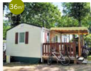
Galion Modèle 2002